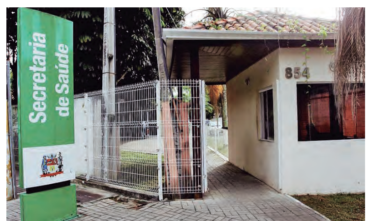
Fachada da Secretaria de Saúde, em Jacareí

Setor de Transportes Ambulatorial - Atendendo 24 horas - Pacientes agendados anteriormente.