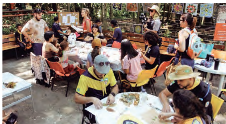
Viveiro Municipal de Jacareí recebe mais uma edição do “Viver o Viveiro”, neste domingo (19)

A programação é de responsabilidade do Instituto Suinã, que realiza ações socioambientais por meio da educação, frutos da assinatura de termo de cooperação entre a Prefeitura Municipal e o instituto. Confira os de-