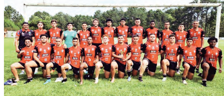
SESI Jacareí Rugby M19 - Campeão Paulista 2023