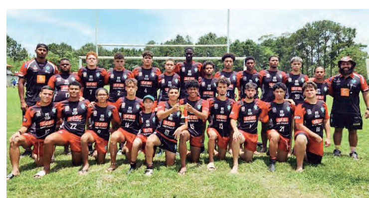
SESI Jacareí Rugby M16 - Campeão Paulista 2023

Agora, os atletas da base de Jacareí seguirão os treinamentos para a disputa da Copa Cultura Inglesa, que reunirá equipes regionais para torneio da modalidade Sevens no fim de dezembro.