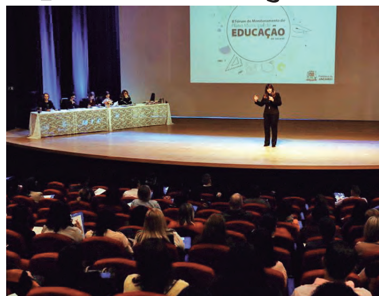
Fórum de Monitoramento do Plano Municipal de Educação no Teatro Ariano Suassuna

O Fórum tem o objetivo de compartilhar os avanços da educação na cidade, e é aberto ao público, para todas as pessoas interessadas neste tema. De acordo