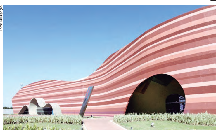
EMEA 2023 acontece na Complexo Educacional Paulo Freire e na FATEC Jacaréi

Respalda por ser uma das poucas cidades do Brasil a possuir uma política e um Programa Municipal de Educação Ambiental - ProMEA e PMEA (lei municipal nº 6.229/2018), Jacaréi reafirma sua vocação e compromisso de cuidar do meio ambiente com o EMEA 2023. O Encontro Municipal de Educação Ambiental, que acontece nos dias 4, 5 e 6 de setembro, com ações nos três períodos e dois lugares de fácil acesso