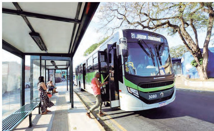
Transporte Público de Jacareí disponibiliza wi-fi gratuito em 100% da frota

No smartphone, basta procurar pelo sinal wi-fi da rede “TRANSPORTE PÚBLICO”. Ao clicar em conectar, o usuário é direcionado para uma tela e realiza um cadastro contendo e-mail, número de celular e criação de uma senha. É com esta senha que o acesso é liberado.