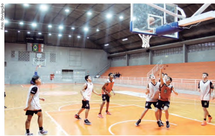
Equipe Sub-15 durante treino no EducaMais Centro

Jacareí estreia, neste sábado (11), a partir das 9h, no Campeonato Paulista de Basquete, no EducaMais Centro, com as categorias de base: Sub-12, Sub-13 e Sub-15.