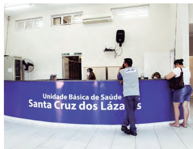
Campanha Especial de Saúde da Mulher durante o mês de março

Unidades de Saúde estarão envolvidas em atividades relacionadas à manutenção da saúde da mulher e prevenção de doenças. As mulheres entre 25 e 64 anos poderão agendar e realizar exames preventivos de câncer de colo de útero (Papa-