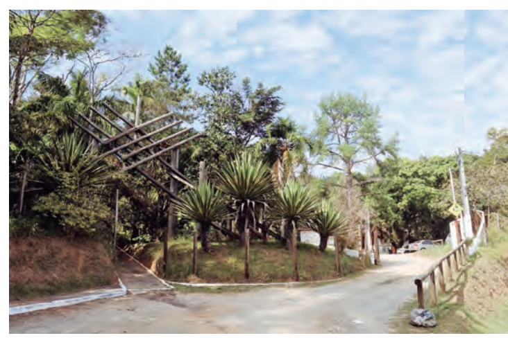
Viveiro Municipal de Jacareí oferece aulas gratuitas de Lian Gong, a famosa ginástica terapêutica chinesa

O Lian Gong promove saúde e qualidade de vida, sendo uma técnica terapêutica baseada em exercícios, com 18 movimentos divididos em três partes do corpo. Os exercícios podem ser praticados por pessoas de qualquer idade, sem riscos envolvidos, mas é sempre importante respeitar os limites de cada um.