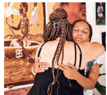
Exposição Fotográfica “Pandemina”