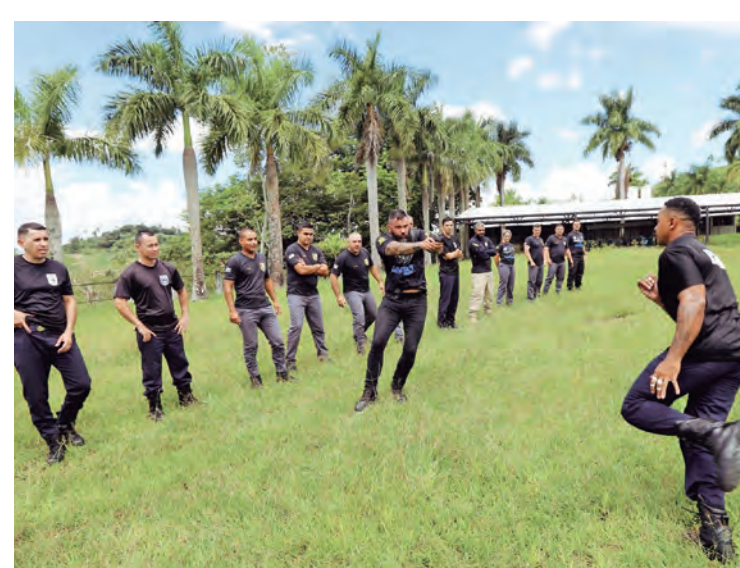
Guardas durante o treinamento